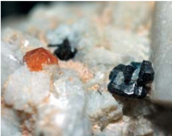
Fig. 108. Cassiterite, cristallo di 3,1 mm, in associazione a spessartina, Rosina, San Piero in Campo, Elba, Livorno, collezione e fotografia G. Maggioni.

Nei campioni di Grotta d'Oggi sovente la cassiterite si trova nelle immediate vicinanze di schörlite e/o foitite (fig. 108). In alcuni campioni del filone Rosina, invece, una associazione riscontrata di frequente per la cassiterite è con schörlite e spessartina. Nel campione della figura 109 è