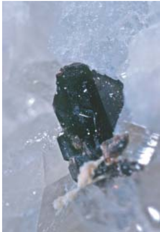
Fig. 106. Cassiterite, cristallo geminato di 2,2 mm, Fonte del Prete, San Piero in Campo, Elba, Livorno, collezione M. Giarduz.