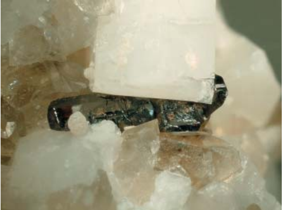
Fig. 110. Cassiterite, cristallo geminato di 3,9 mm, Grotta d'Oggi, San Piero in Campo, Elba, Livorno, collezione M. Giarduz, fotografia E. Bonacina.

curioso un piccolissimo agglomerato sferoidale di cristalli di “stilbite” adagiato su una faccia laterale della cassiterite, “stilbite” che riveste completamente anche alcuni cristalli aciculari di schörlite nelle vicinanze. In genere i cristalli sono tozzi e la colorazione bruno - rossiccia è visibile solamente in quelli più esili (fig. 110).