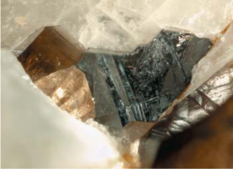
Fig. 107. Cassiterite, cristallo geminato di 2,8 mm, Grotta d'Oggi, San Piero in Campo, Elba, Livorno, collezione M. Giarduz, fotografia E. Bonacina.

Nei campioni di Grotta d'Oggi sovente la cassiterite si trova nelle immediate vicinanze di schörlite e/o foitite (fig. 108). In alcuni campioni del filone Rosina, invece, una associazione riscontrata di frequente per la cassiterite è con schörlite e spessartina. Nel campione della figura 109 è