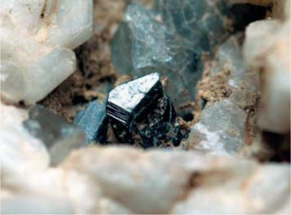
Fig. 105. Cassiterite, cristallo di 3,5 mm, Grotta d'Oggi, San Piero in Campo, Elba, Livorno.