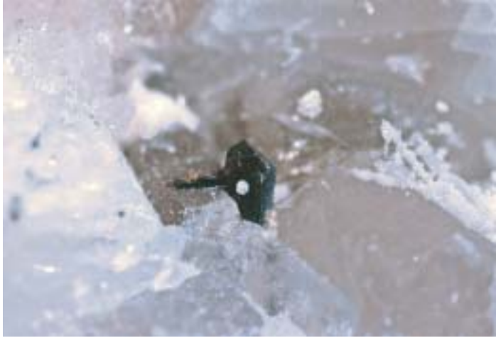
Fig. 109. Cassiterite, cristallo di 1,8 mm, Grotta d'Oggi, San Piero in Campo, Elba, Livorno, collezione M. Giarduz.

curioso un piccolissimo agglomerato sferoidale di cristalli di “stilbite” adagiato su una faccia laterale della cassiterite, “stilbite” che riveste completamente anche alcuni cristalli aciculari di schörlite nelle vicinanze. In genere i cristalli sono tozzi e la colorazione bruno - rossiccia è visibile solamente in quelli più esili (fig. 110).