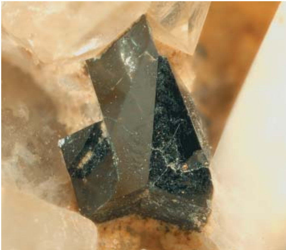
Fig. 103. Cassiterite, cristallo geminato di 2,2 mm, Grotta d'Oggi, San Piero in Campo, Elba, Livorno, collezione M. Giarduz.

Spesso incastonata su feldspato o emergente da prismi di quarzo, più rara ben cristallizzata entro piccole cavità, associata di frequente ad albite e zirconio, columbite-(Mn) e tantalite-(Mn). Solitamente, nei punti di contatto o epitassia con il quarzo, in quest’ultimo si nota una zonatura di colore più scuro, da affumicato a morione (fig. 103).